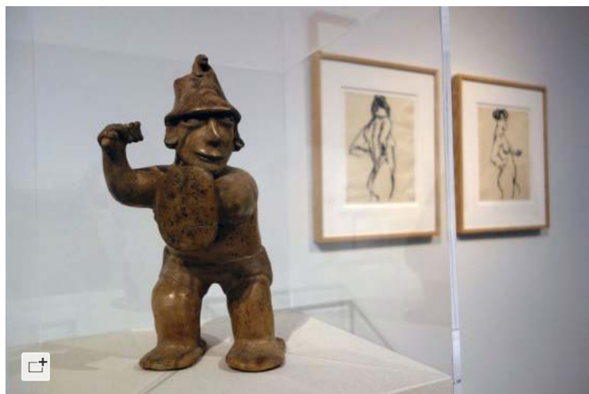
Una obra precolombina junto a dibujos de Josef y Annie Albers, en la exposición de Milán.

Archivado en: Escuela Bauhaus Josef Albers Anni Albers Arte siglo XX Movimientos culturales Historia arte Museos Instituciones culturales Cultura Arte